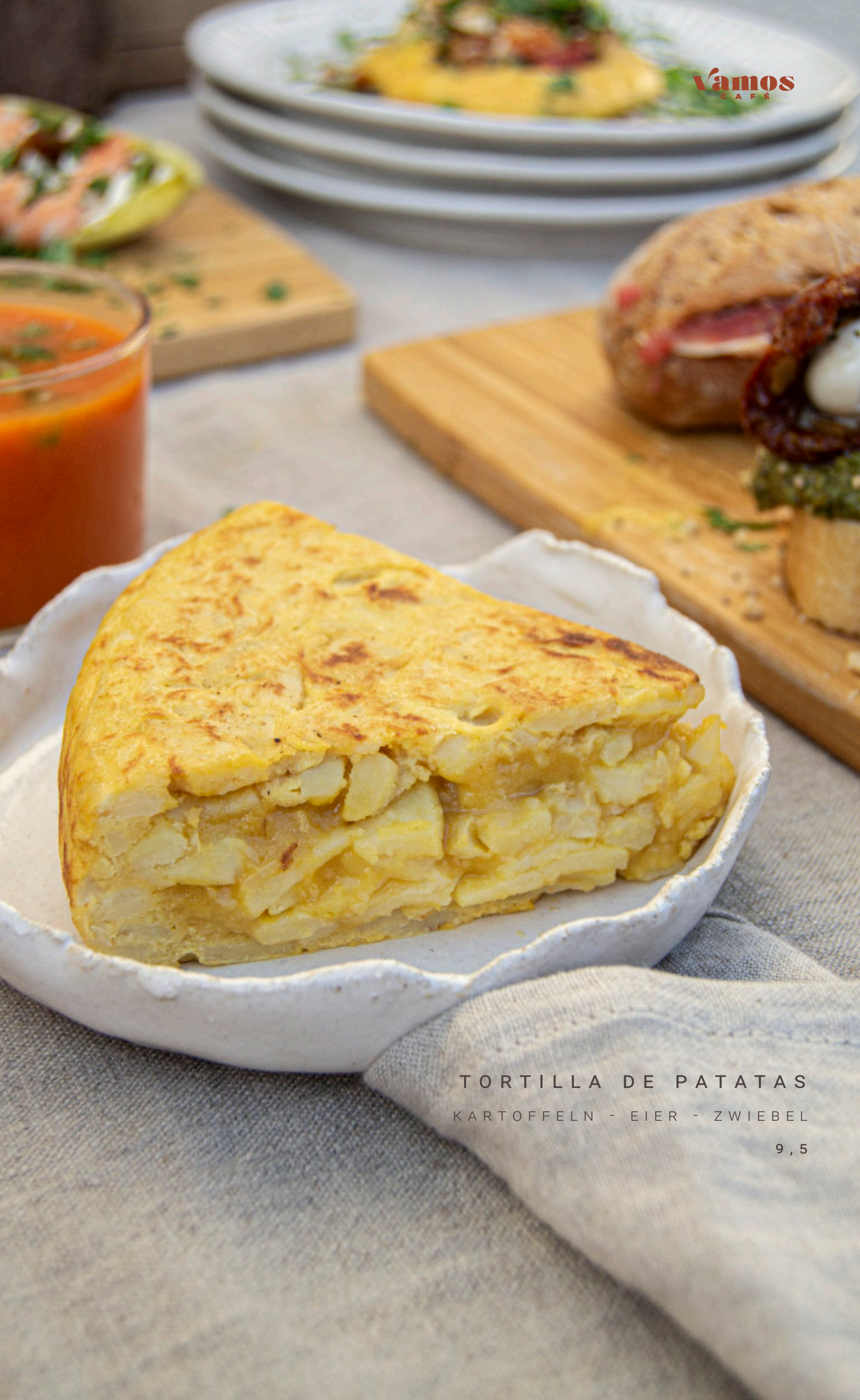
TORTILLA DE PATATAS KARTOFFELN - EIER - ZWIEBEL